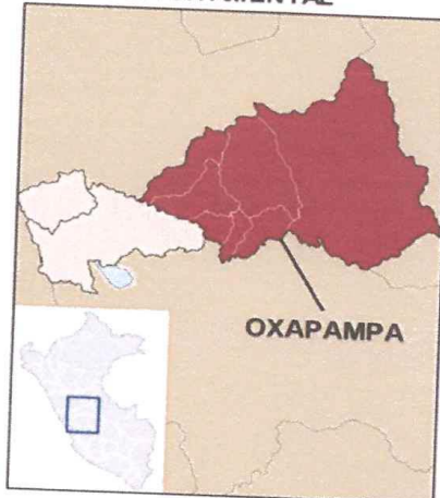
MAPA N° 2: UBICACIÓN DEPARTAMENTAL