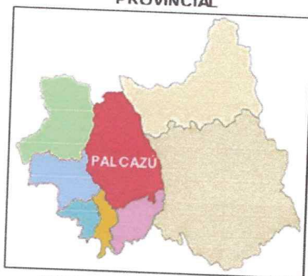
MAPA N° 3: UBICACIÓN PROVINCIAL