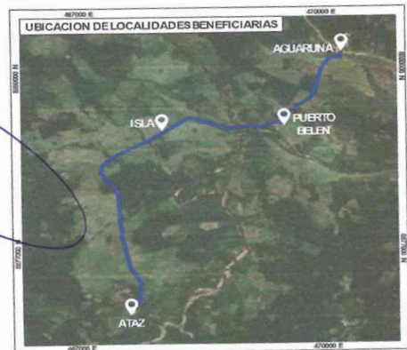
GRÁFICO N° 1: UBICACIÓN DE LAS LOCALIDADES BENEFICIARIAS

PROYECTO: "RENOVACION DE PUENTE PEATONAL; EN EL (LA) QUEBRADA ENRIQUE NANO EN LA VIA PA 716 HACIA ATAZ, EN EL CASERIO BELEN, CENTRO POBLADO 7 DE JUNIO EN EL CENTRO POBLADO 7 DE JUNIO (VILLA AMERICA), DISTRITO DE PALCAZU, PROVINCIA OXAPAMPA, DEPARTAMENTO PASCO" CON CODIGO UNICO DE INVERSION N° 2640935.