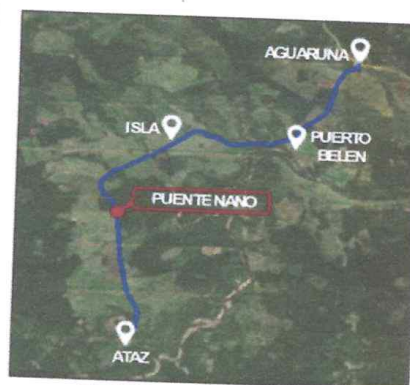
MAPA N° 4: UBICACIÓN DISTRITAL