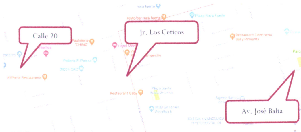
Fig. N°01: Ubicación del proyecto