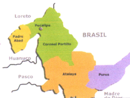
Mapa macro localización del departamento de Ucayali