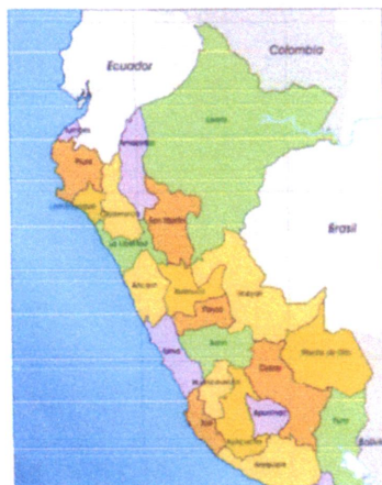
Mapa de macro localización del Perú

El presente Proyecto se ejecutará en las vías del Jr. Los Ceticos (entre Av. José Balta hasta la calle 20), perteneciente al Distrito de Manantay, Provincia de Coronel Portillo, Región de Ucayali. Geográficamente la ciudad de Pucallpa se encuentra ubicada entre las coordenadas: 08°23'04" de latitud sur; y, 74°31'57" de longitud oeste, una altitud de 154 m.s.n.m. La zona de intervención del proyecto está ubicada en la parte sur este de la ciudad de Pucallpa, perteneciendo a la zona urbana de la ciudad.