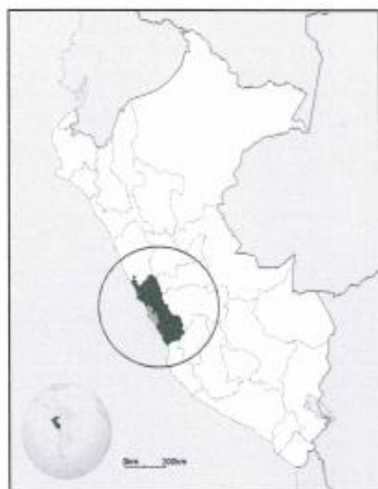
GRÁFICO °01. Localización del Proyecto

Coordenadas UTM de Referencia: Datum: World Geodesic System, Datum 1984 – WGS84 Proyección: Universal Transversal Mercator, UTM. Sistema de Coordenadas: Planas. Zona UTM: 18L.