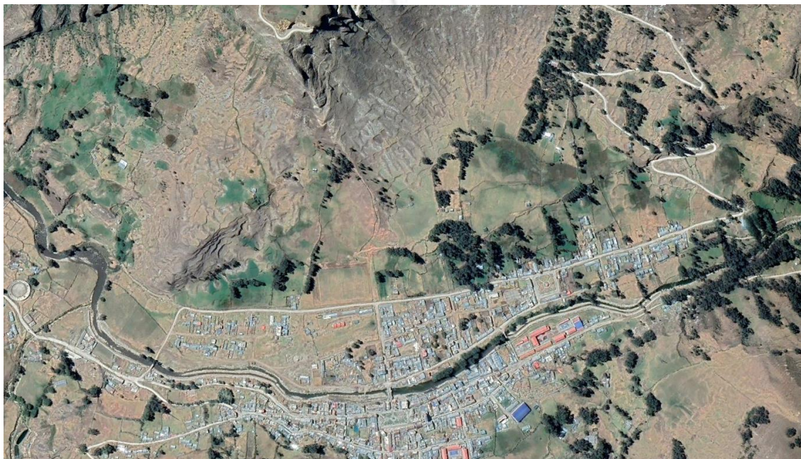
Imagen satelital: Se observa Centro Poblado de La Merced.