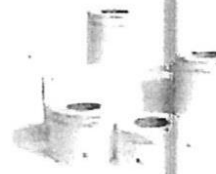
Fig. 1. Manga tipo tyvek con Indicador químico para esterilización por plasma peróxido de hidrogeno 58% - 59%. (no incluye diseño)

Es el envoltorio de elección para la esterilización por plasma peróxido de hidrogeno.