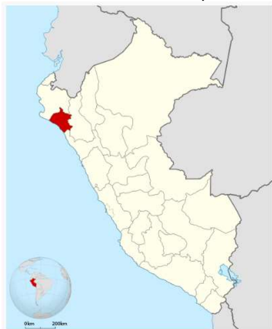
Ubicación de Lambayeque en el Perú.