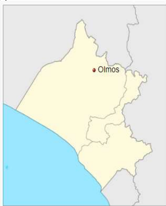
Localización de Olmos en Lambayeque