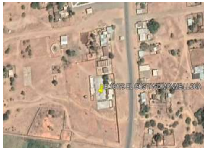
Localización de la zona del proyecto