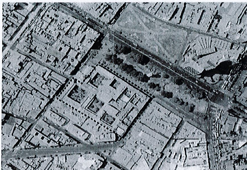
Figura 1 Ubicación del Centro Cultural de San Marcos

Nota: Adaptado de https://earth.google.com/web/@-12.04692769