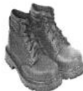
Zapato de seguridad Puntera Acero