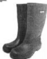
Bota de Jebe

Equipos de Protección Personal (EPPs) los cuales deberán ser reemplazados de acuerdo a la necesidad. En el caso de los cascos de protección estos deben cumplir con los requisitos de absorción de impacto y resistencia a la penetración el personal de mantenimiento deberá usar cascos de color anaranjado, mientras que de los jefes de mantenimiento deberá ser color azul.