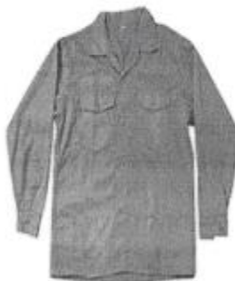
Uniforme de Mantenimiento