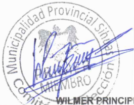
WILMER PRINCIPE SIMEON