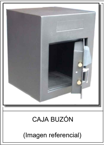
CAJA BUZÓN (Imagen referencial)