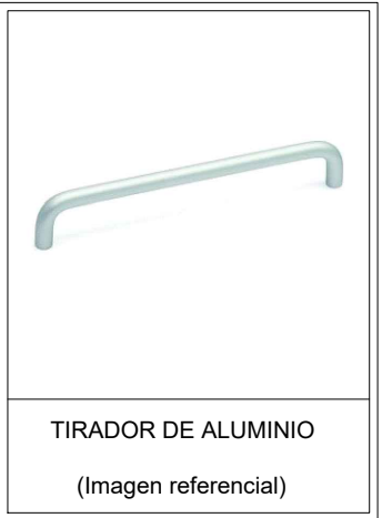
TIRADOR DE ALUMINIO (Imagen referencial)