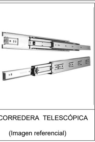
CORREDERA TELESCÓPICA (Imagen referencial)