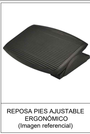
REPOSA PIES AJUSTABLE ERGONÓMICO (Imagen referencial)

PESO: 30 KG APROXIMADAMENTE MARGEN DE ERROR : +/- 10 MM