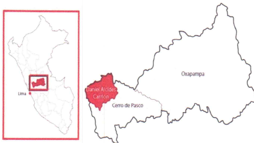
FIGURA N° 1 UBICACIÓN DEL PROYECTO