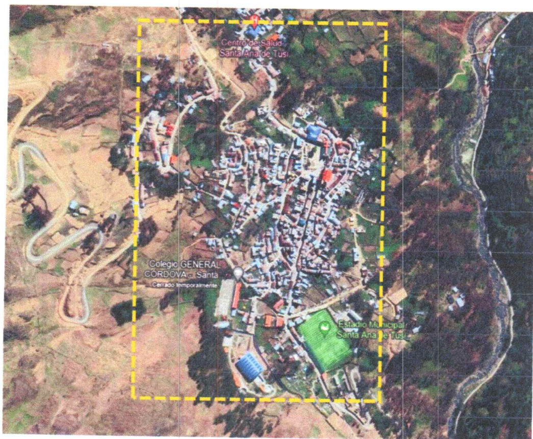
FIGURA N° 2 UBICACIÓN GEOGRÁFICA DEL PROYECTO

El presente Proyecto a ejecutarse se encuentra en el Distrito de Santa Ana de Tusi, está ubicada en una altitud aproximada de 3760.00 msnm. El Distrito de Santa Ana de Tusi es uno de los distritos que conforman la provincia de Daniel Alcides Carrión, perteneciente a la Región Pasco.