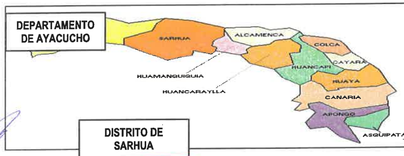
Mapa N°2: Micro Localización del PIP