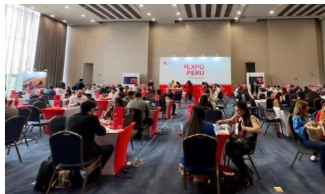
Imagen de referencia de distribución sala.