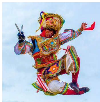
Imágenes referenciales de trajes típicos

Características de Paletas promocionales para activación: