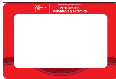
Imagen referencial de arte de marco para fotos