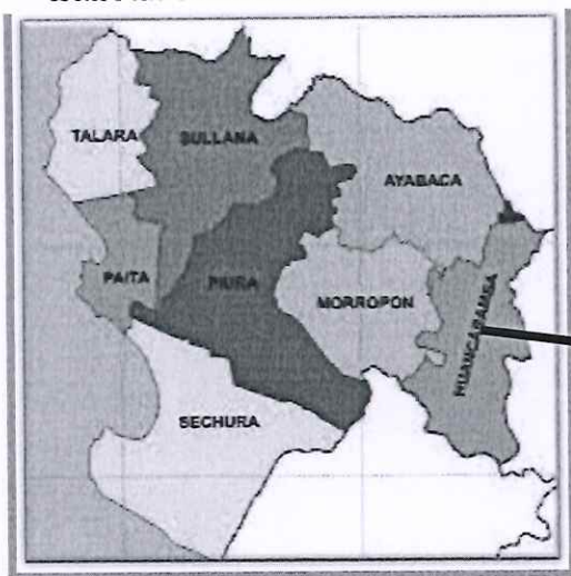
MAPA N° 01