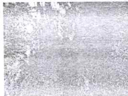
Captación rústica de piedras