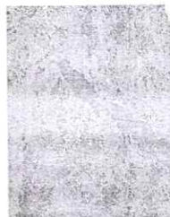
Canal de tierra existente