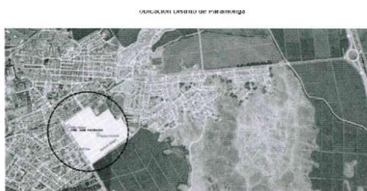
Urb. San Patricio