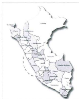
Ubicación Departamento de Lima