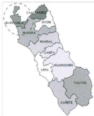
Ubicación Provincia de Barranca