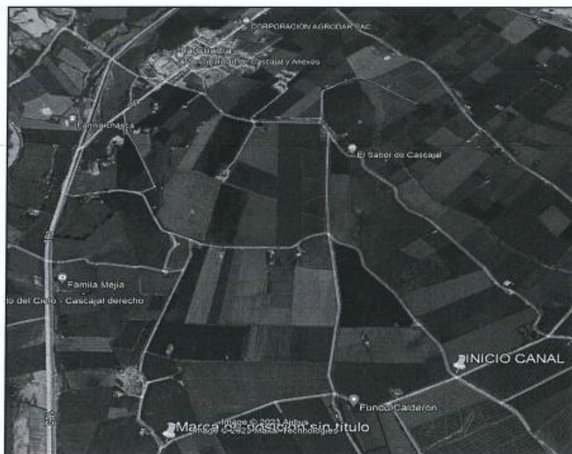
Figura N°01: Ubicación del Canal Dren Escuela, Distrito de Chimbote, Provincia de Santa, Región Ancash

El proyecto se encuentra ubicado en el distrito de Chimbote