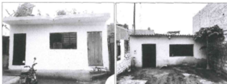
Imagen 01. Vista del área correspondiente a inmueble afectado ubicado en Calle Puno N° 383 – Psje. La Virgen N° 108.