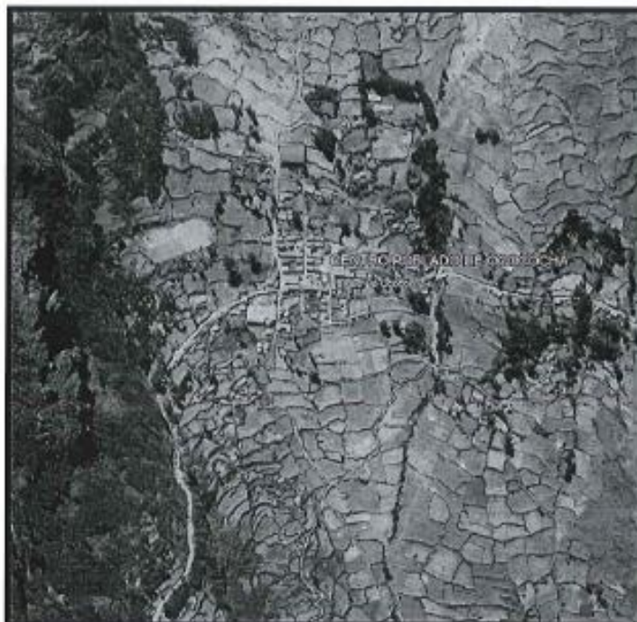
Lugar del proyecto.