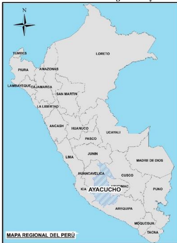
Ilustración 1: Ubicación de la región de Ayacucho