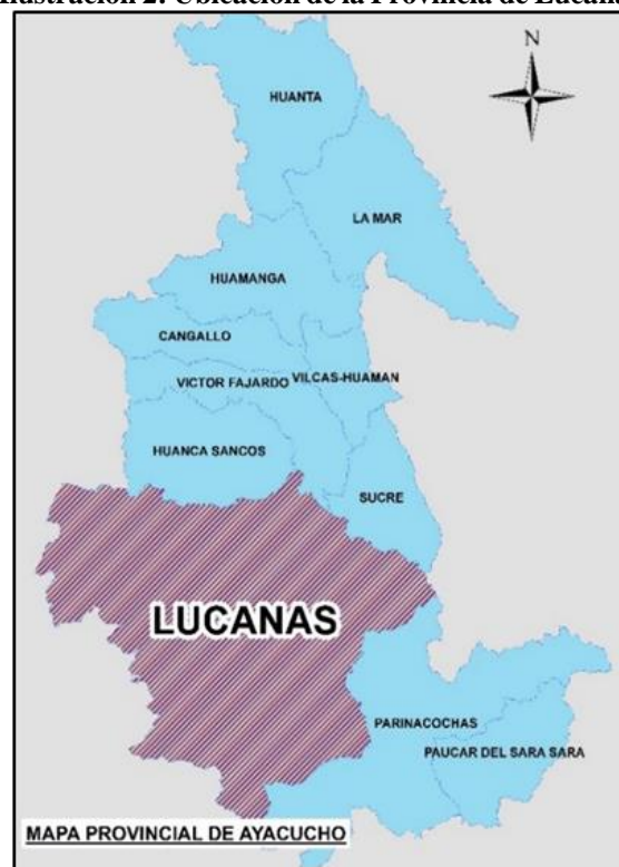
Ilustración 2: Ubicación de la Provincia de Lucanas