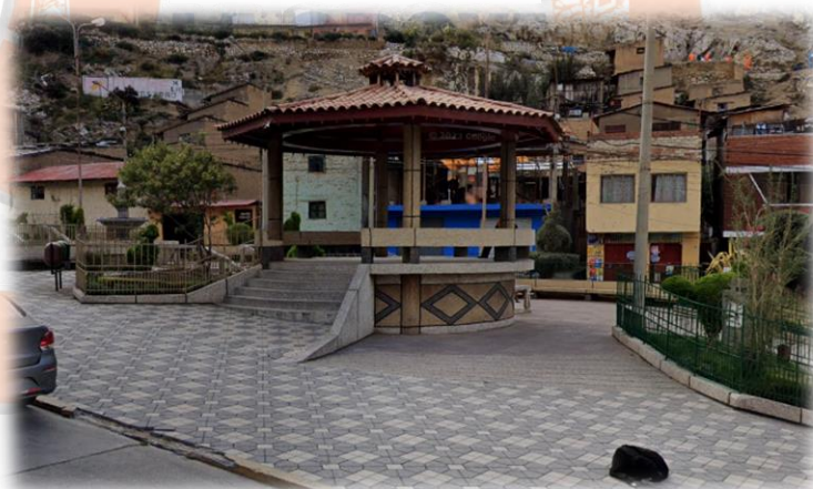
Fig. 4: Situación actual del proyecto