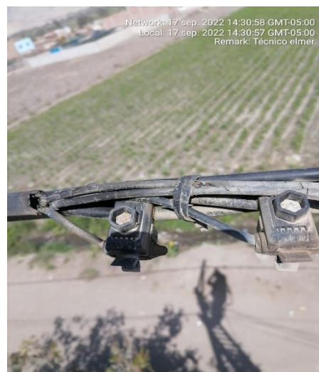
Conductor Tripolar en mal estado