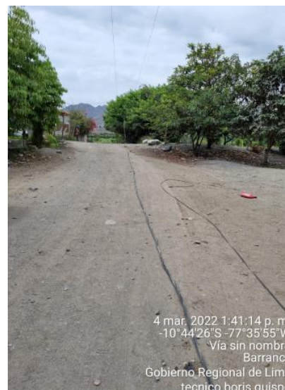
Caída de conductor autoportante, por deterioro del conductor y ferreteria