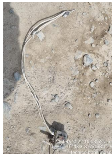
Conductor neutro deteriorado por contaminación de polvareda de la zona.