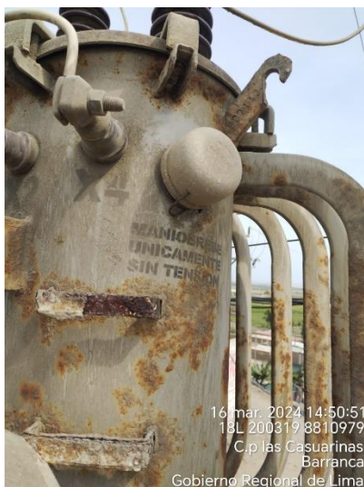
Transformador con el tanque oxidado