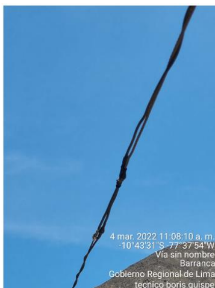
Conductor de Red Secundaria deteriorado