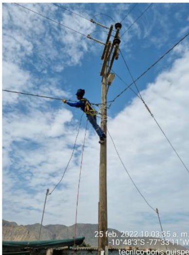
Alta frecuencia de intervención en redes secundarias