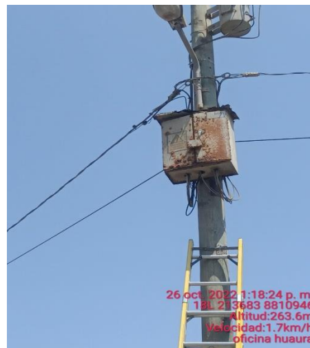
Tablero de distribución en mal estado