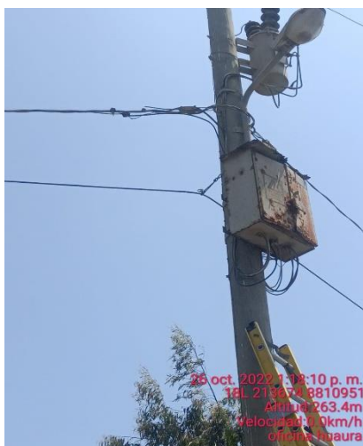
Tablero de distribución en mal estado