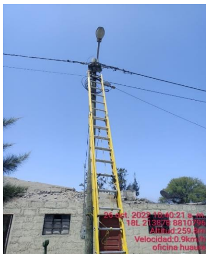
Caja de derivación en mal estado