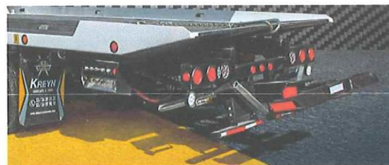
Brazos hidráulicos (Wheel Lift)