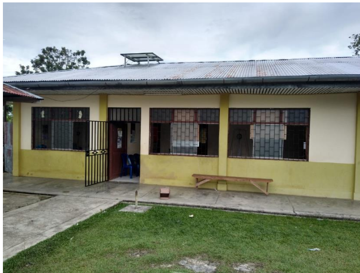
IMAGEN 1: VISTA FRONTAL DEL PUESTO DE SALUD BARRIO FLORIDO

El proyecto de inversión a nivel del Expediente Técnico a ser formulado a Nivel de Estudio Definitivo se ha denominado como: "CONSULTORÍA DE OBRA PARA LA ELABORACIÓN DEL EXPEDIENTE TÉCNICO DE OBRA Y EQUIPAMIENTO DEL PROYECTO DE INVERSIÓN DENOMINADO: PROYECTO: MEJORAMIENTO Y AMPLIACION DEL SERVICIO DE ATENCIÓN DE SALUD BÁSICOS EN BARRIO FLORIDO DISTRITO DE PUNCHANA DE LA PROVINCIA DE MAYNAS DEL DEPARTAMENTO DE LORETO – CUI 2608942