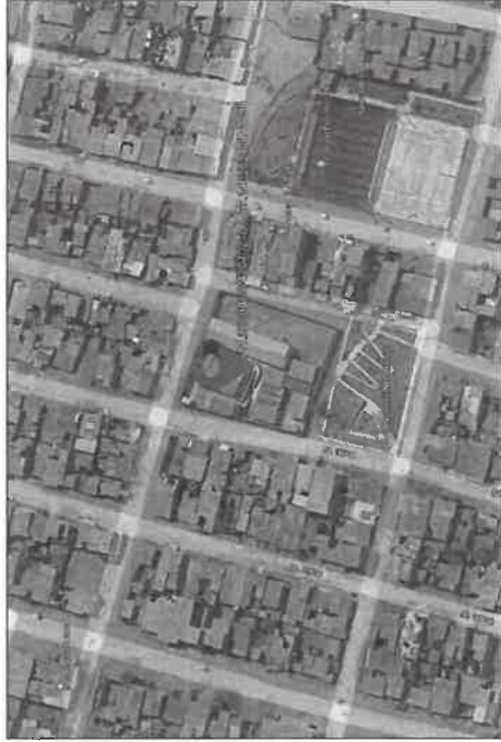
Figura N°1: Ubicación de la I.E. N°152.