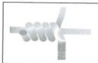
Figura 1. Unión Articulada