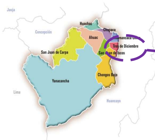
Mapa: Provincia de Chupaca