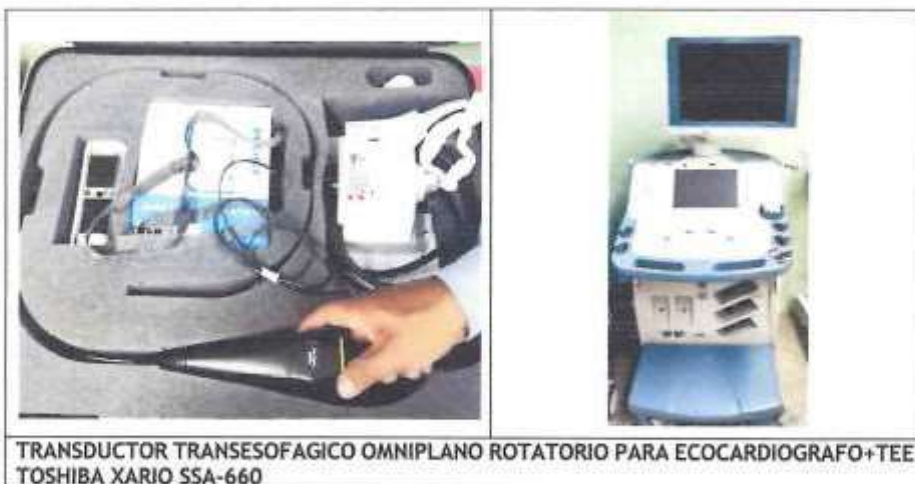
TRANSDUCTOR TRANSESOFAGICO OMNIPLANO ROTATORIO PARA ECOCARDIOGRAFO+TEE TOSHIBA XARIO SSA-660