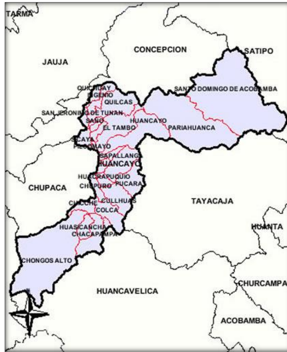
Mapa de Huancayo, ubicando Distritos de Huancayo