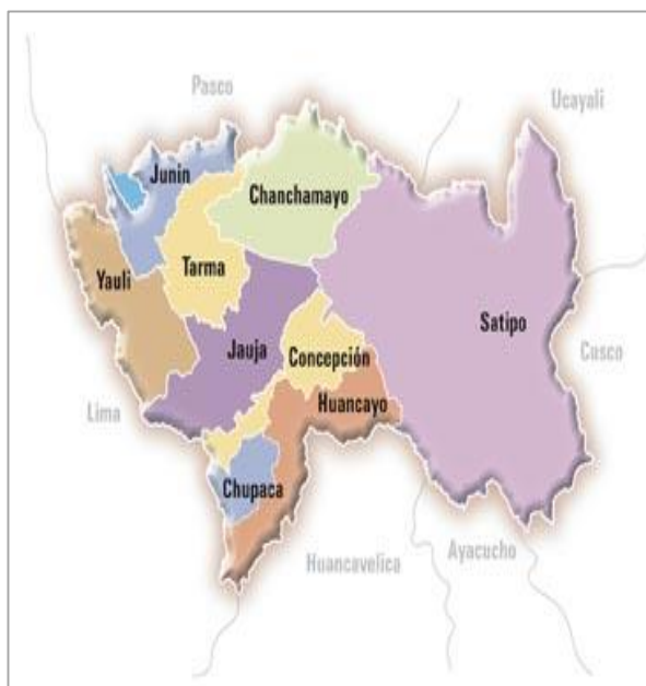
Mapa de Junín, ubicando la provincia de