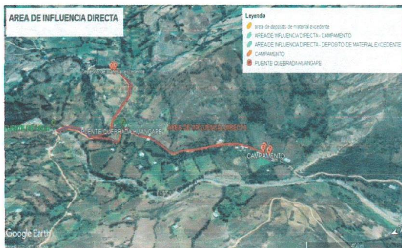
Imagen de Fuente Google Maps