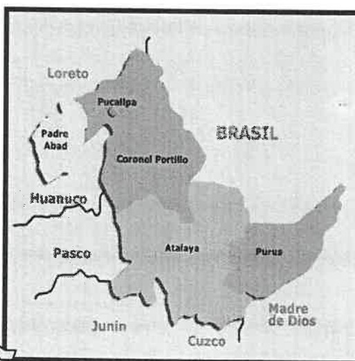
FIG. 02 Mapa macro localización del Departamento de Ucayali