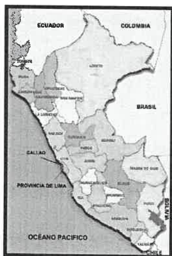
FIG. 01 Mapa de macro localización del Perú

El proceso consiste en el realizar la renovación y mantenimiento del sistema de suministro eléctrico de las áreas de recreación para el público en general del malecón turístico y recreativo villa atalaya de la ciudad de atalaya.