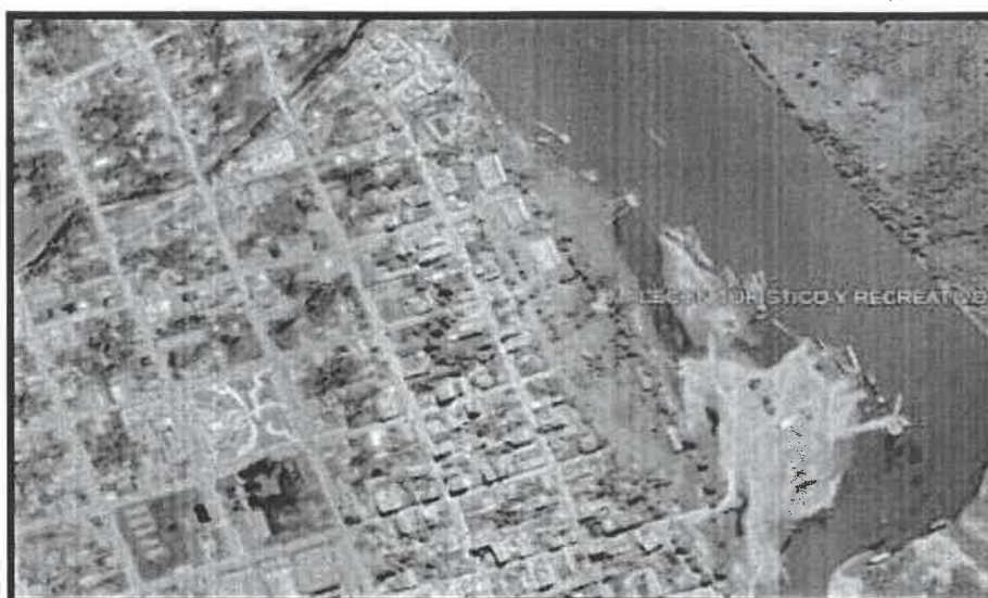
FIG. 04: Ubicación del proyecto, vista satelital