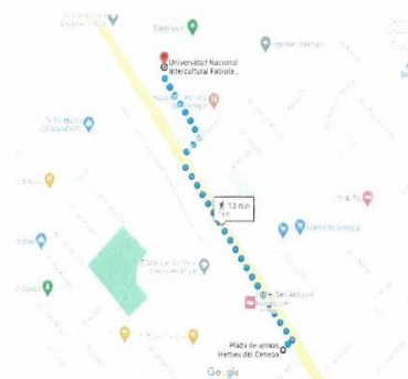
IMAGEN 3: VIA DE ACCESO-PLAZA DE ARMAR-UNIFSLB