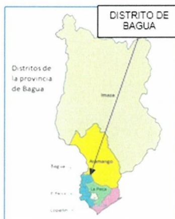
IMAGEN N°02: UBICACIÓN DISTRITAL