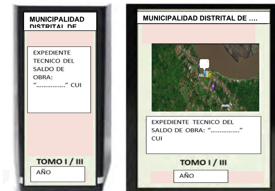
Figura 1. Forma de presentación del Expediente (ejemplo)

Nota. - Cada uno de los documentos que conforman el Expediente Técnico, deberá estar firmado por el Ingeniero jefe de Proyecto y los Ingenieros Especialistas responsable de su ejecución.