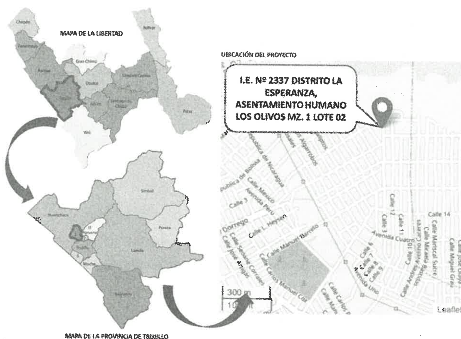
GRÁFICO N° 01