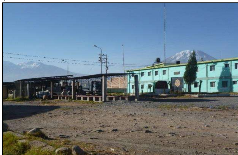
Imagen 02: Vistas EP Varones

Construido en los años 1985 a 1987; funciona desde el 03 de junio de 1987, está ubicado en la quebrada la Chucca jurisdicción del Distrito de Socabaya, provincia de Arequipa, el terreno de este recinto penitenciario está debidamente saneado a nombre de la Institución. Este penal en un principio fue construido para albergar 600 internos. Cuenta un edificio de 2 pisos para el área de admisión y administración, seguridad externa, también cuenta con 2 Pabellones de Internamiento, divididos cada uno en 2 alas, cuenta también con cocina, tratamiento, centro médico, aulas CEBA, talleres industriales (Carpintería, tejido, confección textil, zapatería, estructuras metálicas). Cuenta con un área de 11,598.79 m 2 de área techada