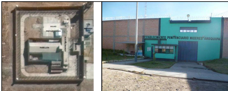
Imagen 03: Vistas EP Mujeres

penal fue construido para albergar 67 internas. La Seguridad Interna y externa está a cargo del INPE desde cuando funciona. Cuenta un área de seguridad externa, área de control de acceso, área para visitas, edificio de 2 pisos donde funciona la dirección, oficinas administrativas, cocina, seguridad externa, pabellón de mujeres con 2 alas y 2 patios área de talleres, aulas, y consultorios. Cuenta con un área de 2114.66 m 2 de área techada