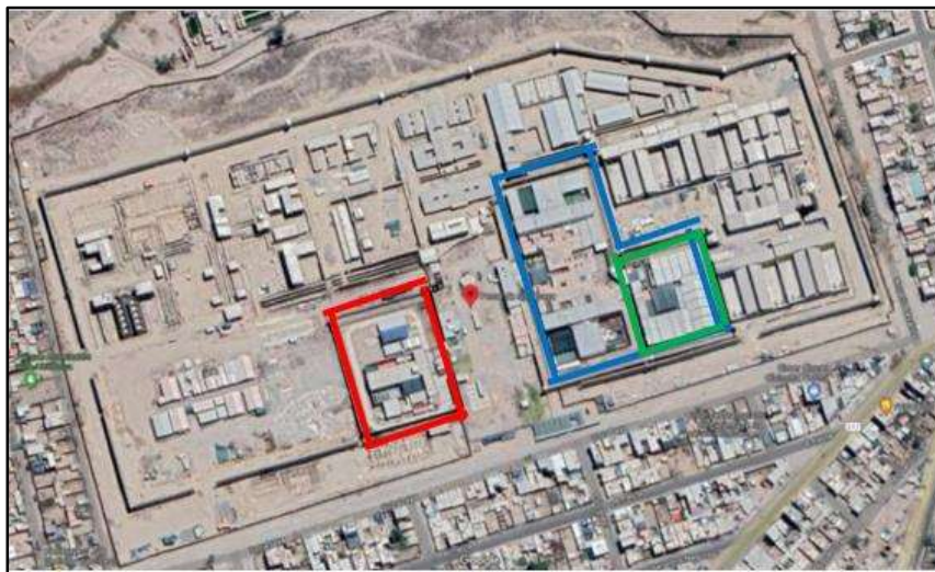
Imagen 01: Imagen aérea de la situación actual los EP Varones y EP Mujeres

Dentro del terreno del establecimiento penitenciario de Socabaya- Arequipa, se encuentra la obra paralizada con un avance del 43.53%, a la resolución del contrato.