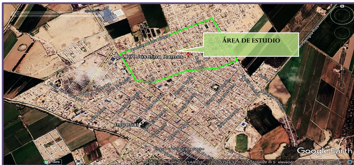
Imagen N°1. Vista Satelital del área de estudio - AA.HH. Josefina Ramos.