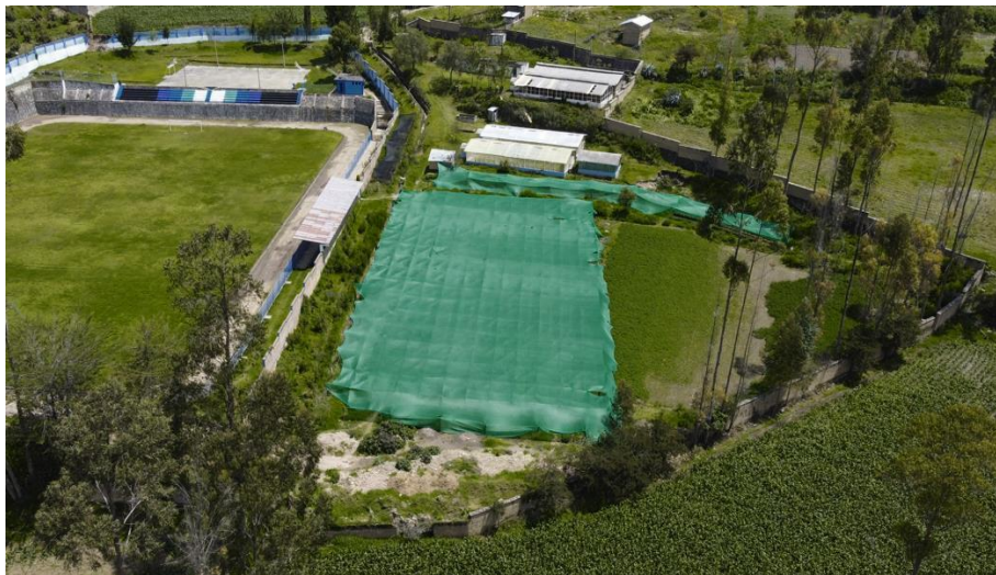
Imagen 01.- vista en planta del terreno

El proyecto se encuentra hacia la población del distrito de Colcabamba, que plantea la prestación de servicios para el adulto mayor (población más vulnerable para casos sociales).