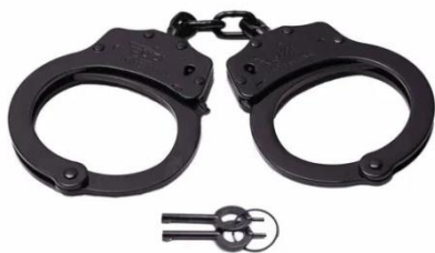
IMAGEN REFERENCIAL – GRILLETES