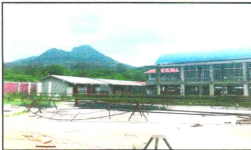
LOMA LARGA BAJA SAN MIGUEL DE EL FAIQUE HUANCABAMBA - PIURA 2024

MEJORAMIENTO DEL SERVICIO EDUCATIVO INICIAL PRIMARIA Y SECUNDARIA EN LA I.E. VICTOR RAUL HAYA DE LA TORRE EN LA LOCALIDAD DE LOMA LARGA BAJA DEL DISTRITO DE SAN MIGUEL DE EL FAIQUE PROVINCIA DE HUANCABAMBA- DEPARTAMENTO DE PIURA", CODIGO UNICO DE INVERSION N° 2457237