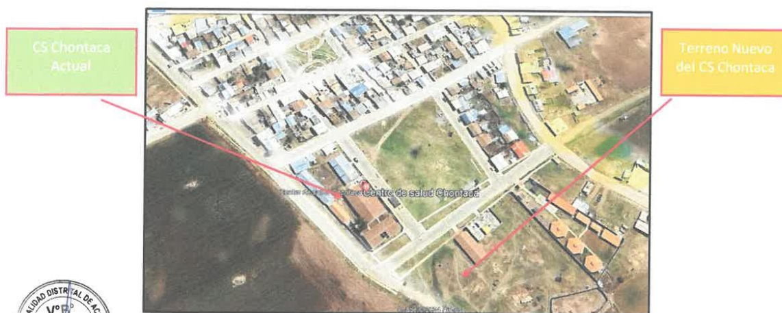
Imagen N°02 Ubicación y Localización de los puestos de salud