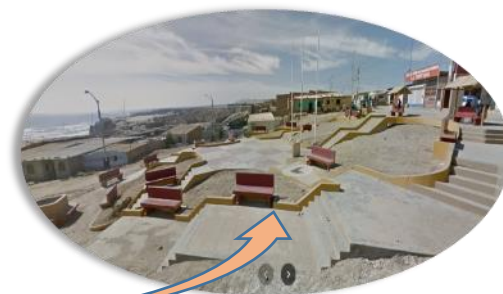
PLAZA "SAN PEDRO" DEL C.P. LA TORTUGA