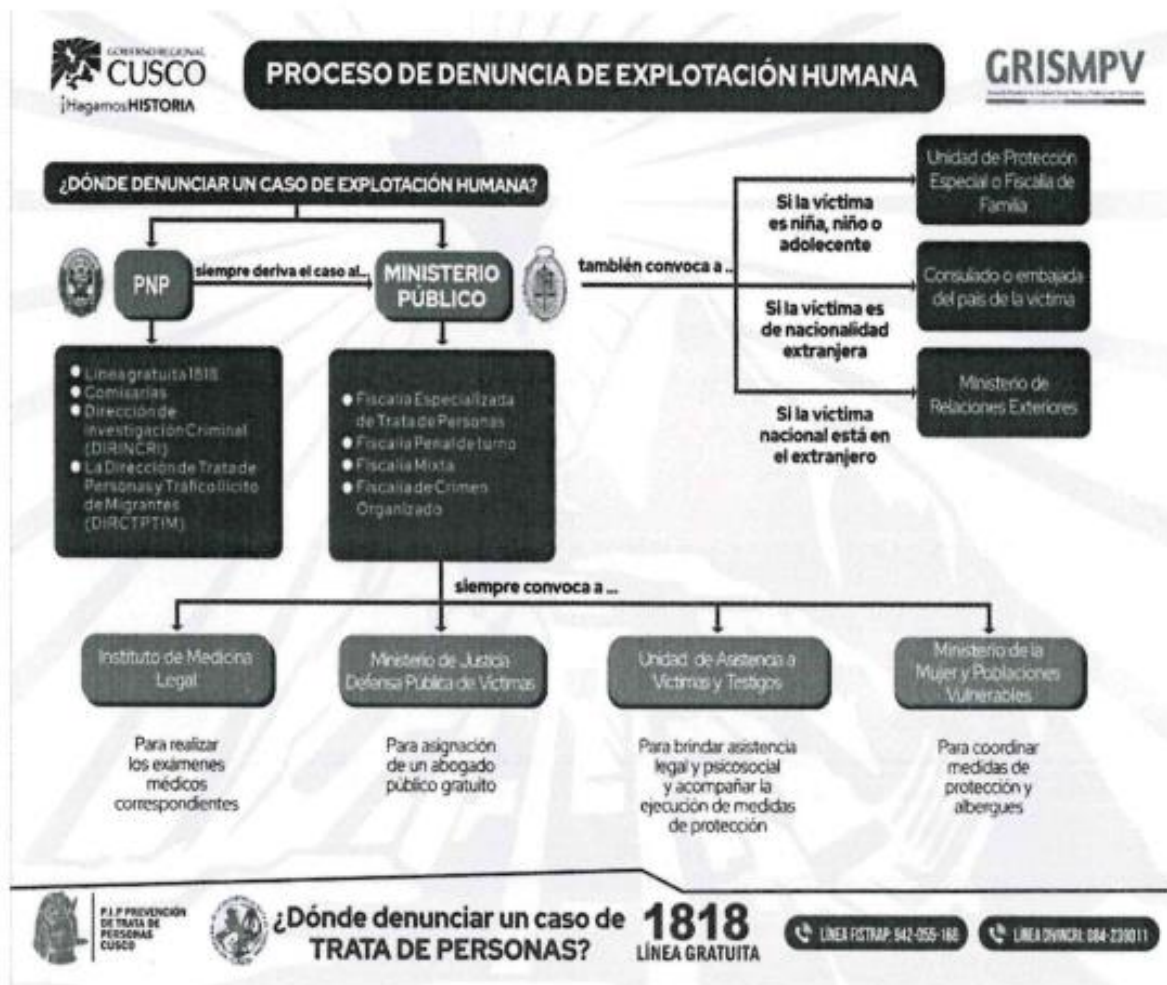
IMAGEN REFERENCIAL (MODELO 2)