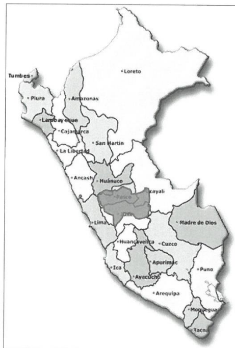
MAPA 01: MACRO LOCALIZACIÓN DEL ESTUDIO