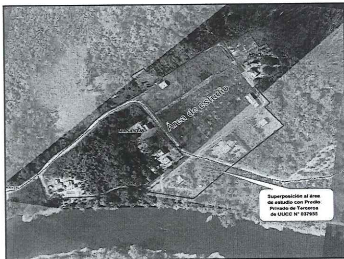
Fig. N°02: Se observa la vista satelital de la Centro Poblado Nuevo Naranjal.