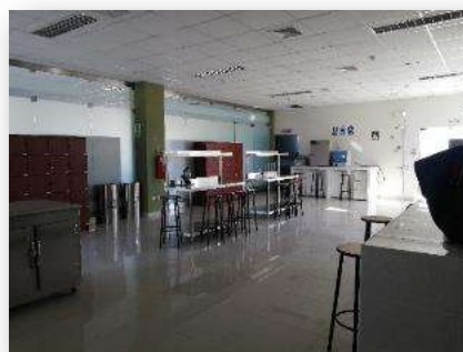
Laboratorio de Ingeniería de Alimentos