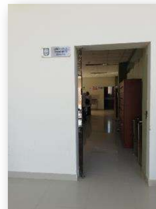
Laboratorio de Tecnología de Alimentos