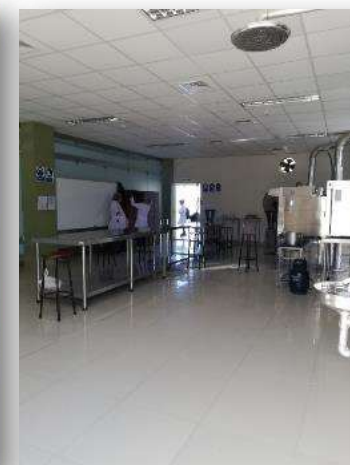
Laboratorio de Análisis de Alimentos