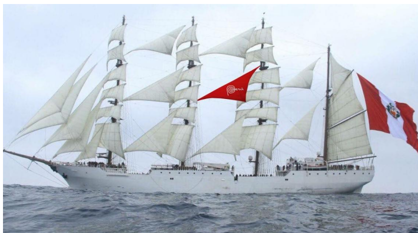
(*) Imagen Referencial de cómo quedaría la vela roja con logo blanco en el buque.