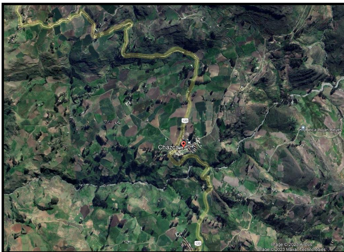
FIGURA N°02: UBICACIÓN DE LOCALIDAD DE CHAZCA