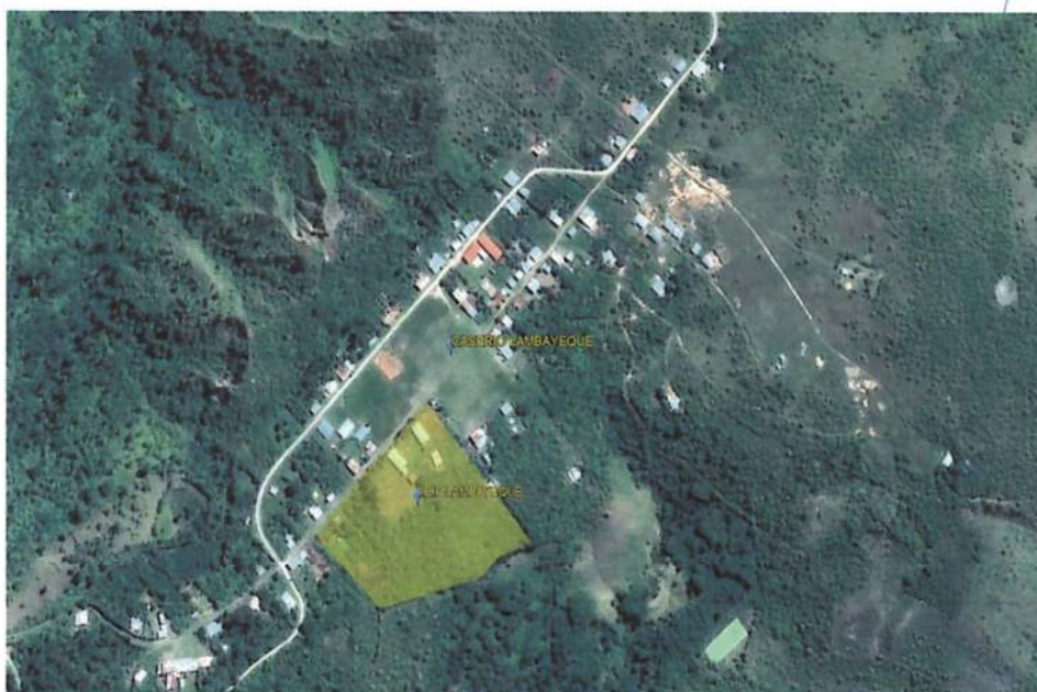
IMAGEN 01: LOCALIZACIÓN GRÁFICA DE LA LOCALIDAD DE LAMBAYEQUE

ESTUDIO DE FUNDAMENTOS ECONÓMICOS Y FINANCIEROS DEL PROYECTO DE CONSTRUCCIÓN DE UN CENTRO DE DISTRIBUCIÓN DE ALIMENTOS