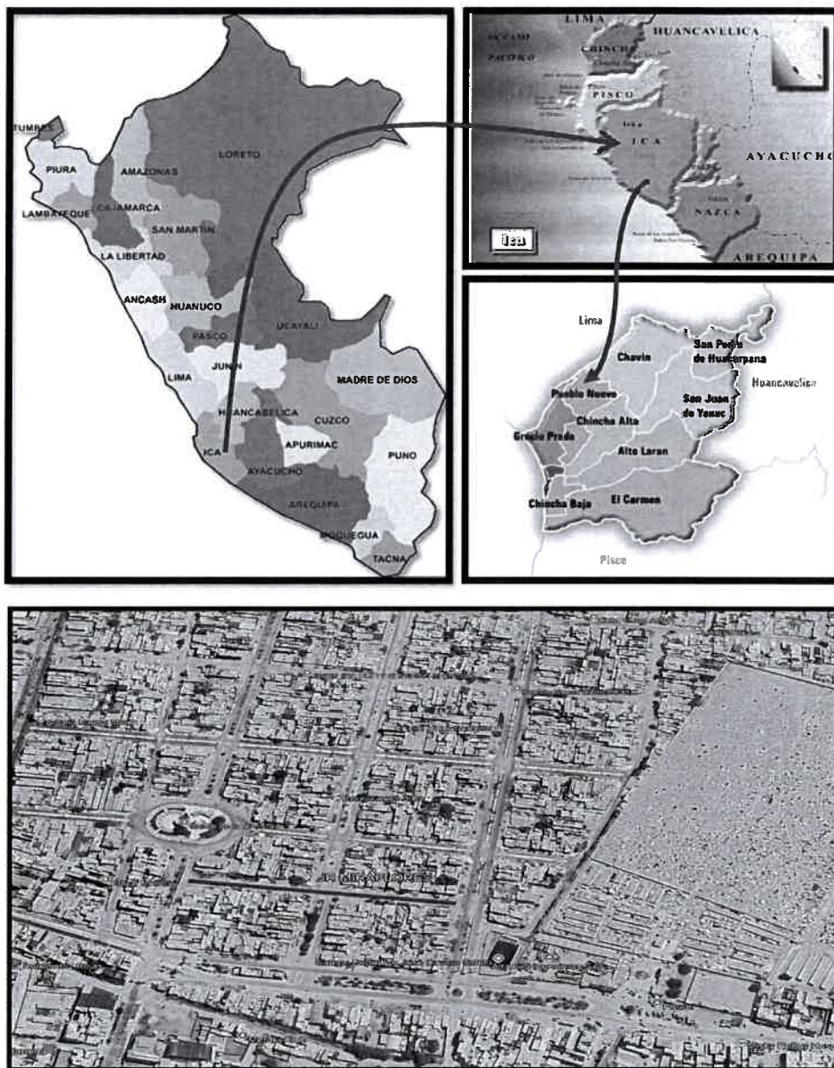
Foto satelital área de intervención