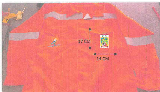
IMAGEN N°03: CAMISA (PARTE DELANTERA)