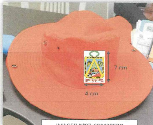
IMAGEN N°07: SOMBRERO