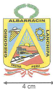
IMAGEN N°10: LOGO DEL ESCUDO DEL DISTRITO